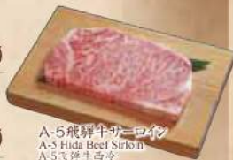
A-5飛騨牛サーロイン A-5 Hida Beef Sirloin A-5飛騨牛西冷