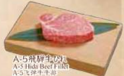
A-5飛騨牛ひれ A-5 Hida Beef Fillet A-5飛騨牛牛排

メニューは一例です。 上記以外にも、ご飯物、サラダ、各種スープ等 多数メニューを取り揃えております。 各店舗によりメニューは若干異なります。