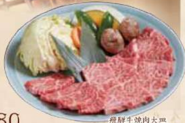
飛騨牛焼肉大皿 Hida Beef Big Dish 飛騨牛焼肉大皿

A-5飛騨牛ぎぶとん 〔タレ・天然塩〕(100g) A-5 Hida Beef Chuck Flap〔with natural salt or special sauce〕 A-5飛騨牛特選肋骨肉〔佐料、天然塩〕